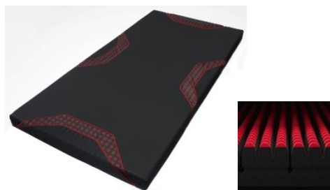
【エアー-SI】マットレス ¥76,000円+税～

アスリートの遠征、ビジネスマンの出張など、外泊時のホテルなどで快適な眠りを提供します。