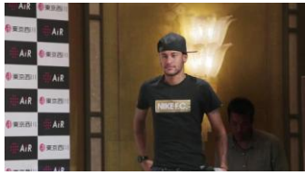
記者会見会場に登場する ネイマール