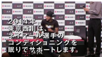
マットレスに座りながら コメントをしている様子の ネイマール