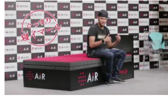
記者会見フォトセッションシーン