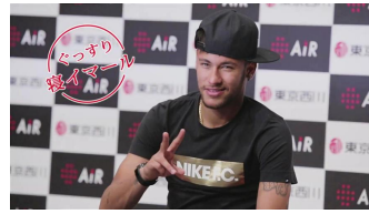
Na(ネイマールボイス): 「ぐっすり寝イマール」