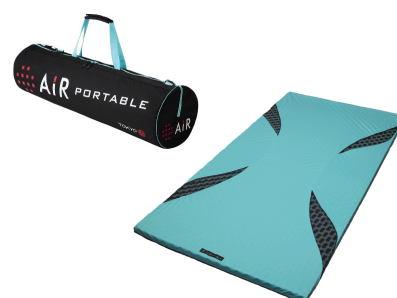
[エア-ポータブル] モバイルマット 価格：¥33,600

「エア」は、2013年9月1日からANA国際線ファーストクラスの マットレスに採用されています。