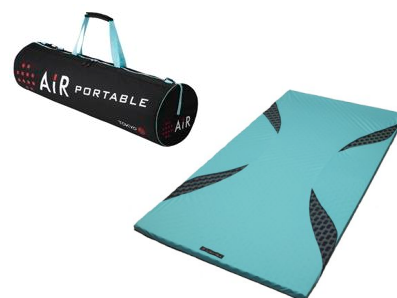
[エア-ポータブル] モバイルマット 価格：¥33,600