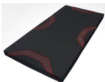
プレミアムモデル [エア-SI] マットレス 価格：79,800円～