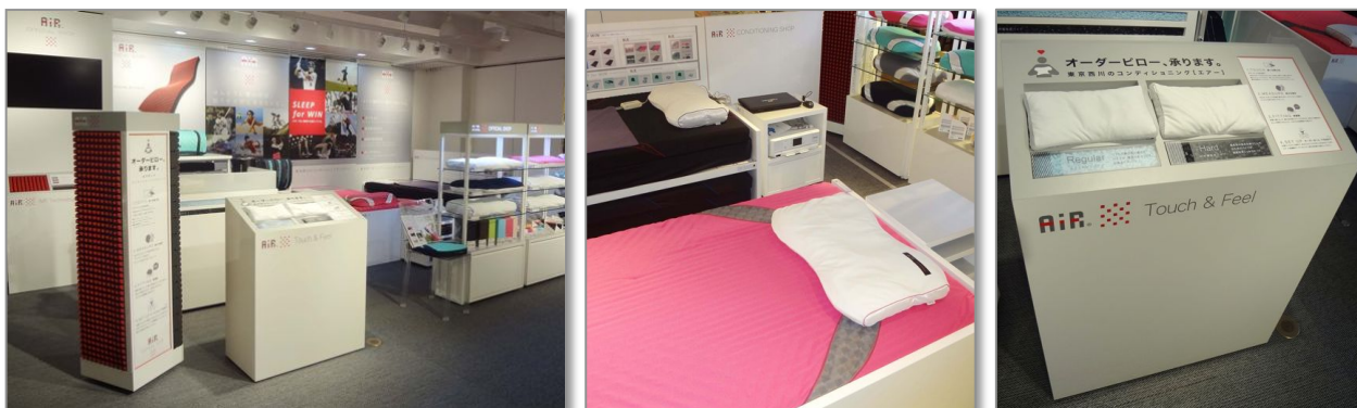
※画像は店舗イメージです。